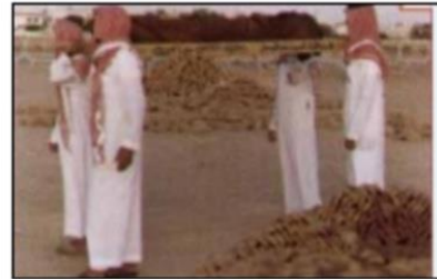
٤- اتباع جنازته

حكمها: فرض كفاية ( إذا قام بها البعض سقط الإثم عن الباقيين )