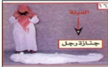
٣- الصلاة عليه