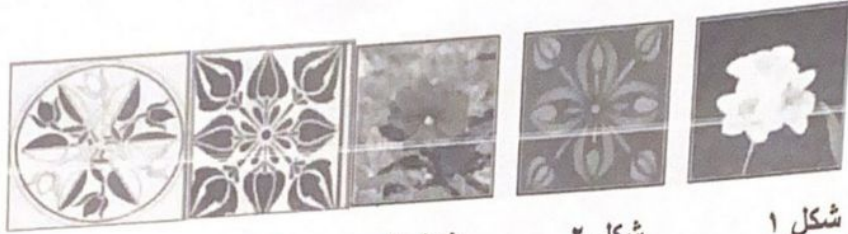
شكل ١ شكل ٢ شكل ٣ شكل ٤ شكل ٥

السؤال الرابع: من الصور السابقة ما الصور المستمدة من الطبيعة وما الصور المجردة عن الطبيعة؟